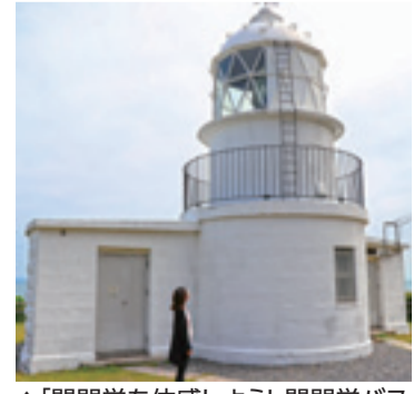
▲「関門学を体感しよう! 関門学バスツアー!」部埼灯台