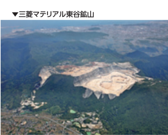
▼三菱マテリアル東谷鉱山