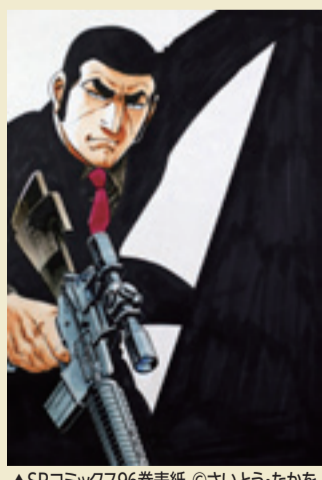
▲SPコミックス96巻表紙 ©さいとう・たかを

24日(日)(2月11日以外の月曜日は休館)の9時30分～17時(入館は16時30分まで)、下関市立美術館(下関市長府黒門東町)で。料一般1200円、大学生900円。18歳以下、70歳以上は無料(証明書の提示が必要)。問同施設 ☎(083)245・4131へ。