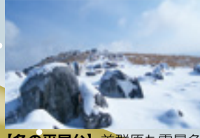
【冬の平尾台】羊群も雪景色に様変わります。