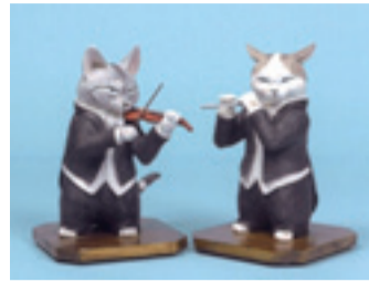
正木卓作「オウケト」平成28年

国内外の絵画や工芸品。4月20日(土)～6月23日(日)の9～18時(入館は17時30分まで)、小倉城庭園(小倉北区城内、☎582・2747)で。料入館料が必要。