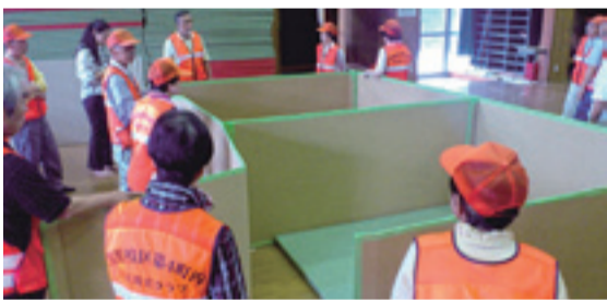
▲ダンボール間仕切りの作成訓練

が、その都度、自主防災クラブ員を中心に話し合いながら、役割分担をして乗り切りました。日頃から、地域の団体や住民同士のつながりが強く、町内全体のコミュニケーションが取れていることが生かされたのだと思います。