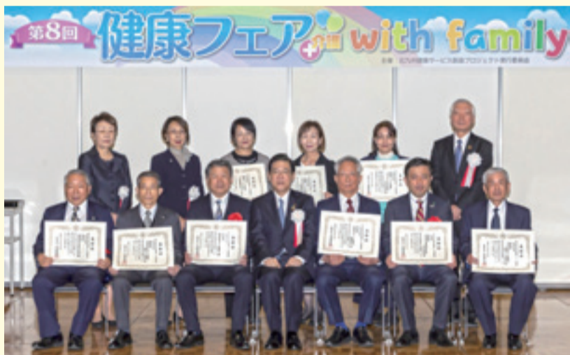
▲平成30年度の受賞者