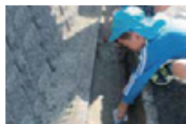
住民による側溝の清掃