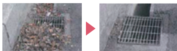
側溝や雨水升に、落ち葉やごみを捨てないでください。