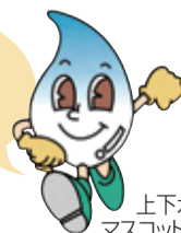
上下水道局のマスコットキャラクター「スイッピー」