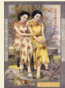
ハン・ジイン/ジイン画室「五洲大薬房ポスター」1920-30年代 福岡アジア美術館蔵

「東アジア」「東南アジア」「南アジア」の地域の美術作品など約350点とアジアの作家たちが福岡で生み出した作品を展示。10月5日(土)~11月26日(火)(水曜日は休館)の9時30分~18時(金・土曜日は20時まで。入館は閉館の30分前まで)、福岡アジア美術館(福岡市博多区下川端町、☎(092)263・1100)で。料一般1000円、高校・大学生800円。