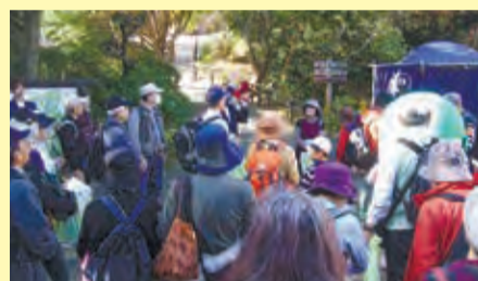
【白野江植物公園を訪れた参加者】

門司区役所では、新門司地区の美しい景観や由緒ある史跡などを皆さんに紹介する「新門司彩発見」事業を実施しています。新門司の名所を巡るバスツアー(3月頃)、ウォーキング(11月頃)の開催や、地域の魅力満載のウォーキングマップの作製など、住民、地元企業、郷土史会の方々と協力して、新門司地区のにぎわい創出に向けた取組みを行っています。