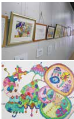
▲個性豊かな障害者アート

「障害者芸術祭」は、障害のある人が芸術・文化活動を発表する場として、また多くの人に障害者アートの素晴らしさを知っていただくため開催しています。作品テーマは「私たちのまち 私たちの文化」。この事業を通じて、障害のある人の生きがいや自信をつくり、社会参加と自立を促すとともに、障害のある人への市民の理解と啓発を進めます。また、「東アジア文化都市北九州」を記念して開催される「商店街かがやきアート展」では、障害者芸術祭作品展の受賞作品などを商店街アーケードに掲示し、日常風景の中で、誰もが気軽に障害者アートを鑑賞できる空間を創出します。いずれも観覧無料です。