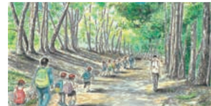
▲昨年度のスケッチ部門グランプリ

作品は市内の長崎街道など(木屋瀬~門司港レトロ)やその周辺で、「わたしの好きな『北九州風景街道』ゆっくりかいどう」をテーマに撮影かスケッチしたもの。フォト部門、スケッチ部門、インスタグラム部門あり。共通応募は1人2点まで。入賞者に賞品を進呈。申来年1月31日まで。詳細は建設局道路計画課 ☎582・3888へ。