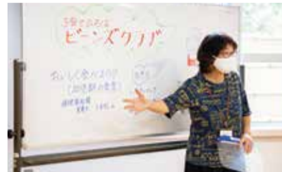
折尾東市民センターのイベント名は「子育てひろばビーンズクラブ」。各センターが自由に命名しています。