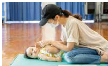
「ラララぞうさん」の歌に合わせて、つついたり、絞ったり、もみもみしたり。