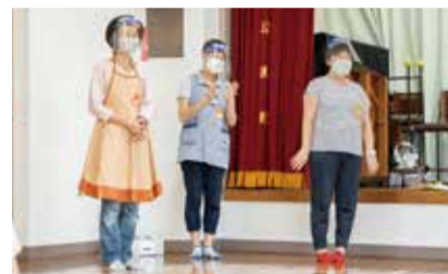
イベントを運営する「子サポ」の皆さん。ちょっとした会話からパパ、ママの悩みを聞いたりも。