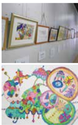
▲個性豊かな障害者アート

「障害者芸術祭」は、障害のある人が芸術・文化活動を発表する場として、また多くの人に障害者アートの素晴らしさを知っていただくため開催しています。作品テーマは「私たちのまち 私たちの文化」。この事業を通じて、障害のある人の生きがいや自信をつくり、社会参加と自立を促すとともに、障害のある人への市民の理解と啓発を進めます。また、「東アジア文化都市北九州」を記念して開催される「商店街かがやきアート展」では、障害者芸術祭作品展の受賞作品などを商店街アーケードに掲示し、日常風景の中で、誰もが気軽に障害者アートを鑑賞できる空間を創出します。いずれも観覧無料です。