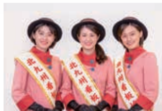
▲第10代北九州看板娘