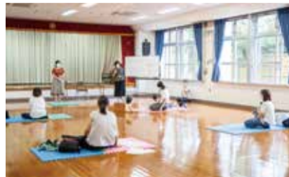
この日は4組の親子が利用。人との距離をしっかりと確保するなど、コロナ対策も万全。

子育てサポーター「子サポ」の活動は、日常的な相談対応と、月1～2回実施する子育てイベントの企画・運営。折尾東市民センターでは毎月第1・2水曜日に子育てイベントを実施しています。イベント時間は約1時間で、この日は子どもたちが歌に合わせて体を動かすリズム体操のほか、栄養士を講師に招き、「おいしく食べよう」をテーマに乳幼児期の食育について話していただくなど、盛りだくさんの内容。参加した親子も「子サポ」の皆さんも、始まりから終わりまで笑顔、笑顔の1時間でした。