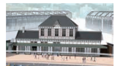
▲新駅舎外観イメージ