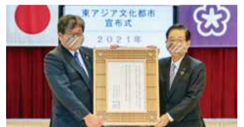
▲東アジア文化都市宣布式