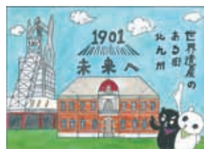
▲今年度の北九州市長賞作品

「世界遺産のある街 北九州市・中間市」ポスターコンクールの受賞作品や世界遺産を紹介するパネルを展示します。