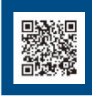
図 産業経済局緊急経済対策室 ☎582・2299

営業時間短縮要請に応じた飲食店の皆さんへの協力金支給(福岡県事業)など、緊急経済支援策の最新情報は、市ホームページ(右記を読み取り)をご覧ください。