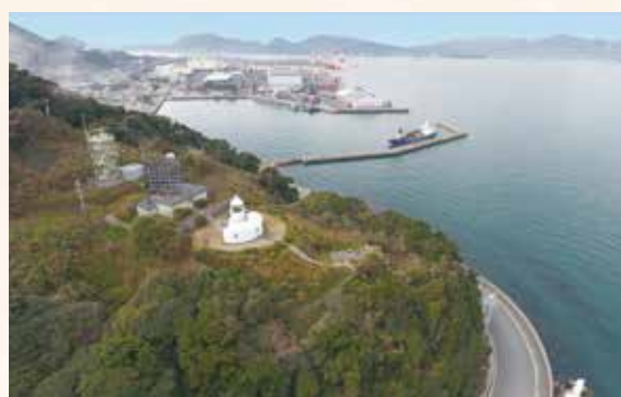
▲関門海峡東(瀬戸内海)側と部埼灯台

ここが見どころ 青い空に映える重厚な白御影石造りや、フランスから輸入した回転式のレンズが美しい灯台です。内部を見ることはできませんが、レンズなど灯台内部の一部機器は明