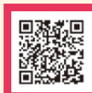
▲マイナンバーカードサテライトコーナー

取扱時間 月・火・金曜日(祝・休日は除く)の11～19時30分 土・日曜日(祝・休日は除く)の9～17時30分