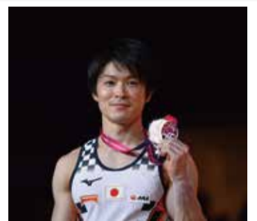
▲2018年 世界体操

※ 広告の申し込みは(株)ホープ ☎(092)716-1404まで。 ※ 広告内容と北九州市とは直接関係ありません。