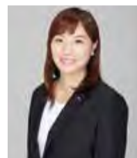
竹下佳江さん (バレーボール)

八幡製鉄(現・日本製鉄)所属時に、1964年東京大会で8位、続く1968年メキシコ大会で銀メダルを獲得し、日本全国を熱狂させました。引退後は北九州市立大学などで教壇に立ちながら地域スポーツの振興に貢献されています。