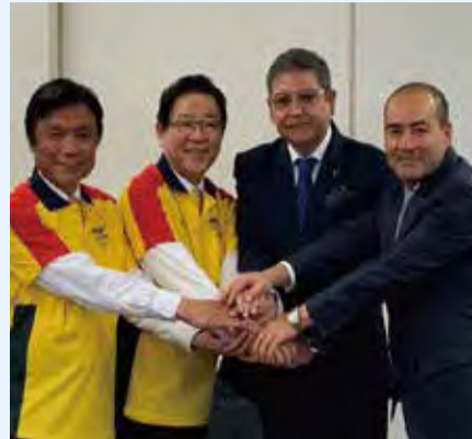
▲コロンビアオリンピック委員会と事前キャンプ実施についての覚書締結式

コロンビア共和国とは、複数種目の事前キャンプ実施について合意しました。2019年には、トランポリン代表が事前キャンプを行い、公開練習や学校訪問などを行いました。また、駐日コロンビア大使館による市内小学校へのオンライン授業や、生徒による研究発表などの交流も行っています。