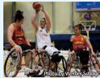
▲女子チームは、前回の2016リオ大会で銀メダルを獲得。今大会でも活躍が期待されます

ドイツの車いすバスケットボール代表チームとは、本市で毎年開催されている車いすバスケットボールの国際大会「北九州チャンピオンズカップ」への参加などを通じて、交流を深めています。ドイツの男女代表チームは、パラリンピック直前に、キャンプを行う予定です。