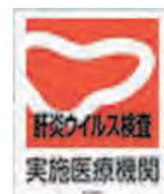
▲肝炎ウイルス検査ステッカー

ウイルス性肝炎は、適切な治療を受けることで重症化を防ぐことができます。肝炎ウイルス検査で陽性となった人が、精密検査を受診し早期治療につながるよう、本市では初回精密検査の費用を助成しています。詳細は各区役所保健福祉課へご相談ください。