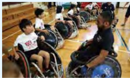
▲西小倉小学校での競技体験

英国車いすラグビー代表チームは、2019年に事前キャンプを行い、学校での競技体験や給食交流、ビデオレターの交換などを行っています。前回のリオ五輪は5位で、今大会でのメダル獲得が期待されています。