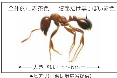
全体的に赤茶色 腹部だけ黒っぽい赤色