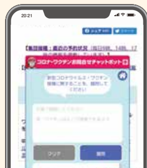
チャットボットイメージ▶

まもなく、お盆の時期となります。会食時のマスク着用等、基本的な感染防止対策を徹底しましょう。また、ワクチン接種後も、引き続き感染予防の徹底をお願いします。