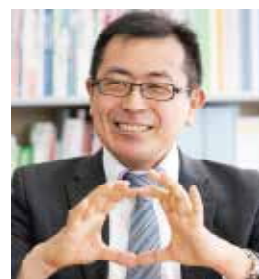
▲東京大学教授・飯島勝矢さん

テーマは「人生100年時代を元気で乗り切るために。健康長寿の鍵はフレイル予防」。9月30日(木)13時30分～16時、ウエルとばた3階(戸畑駅前)で。定150人。☎電話で9月6日までにフレイル予防講演会事務局 ☎03・6205・8448からEメール(下記を読み取り)から。募集要項は各区役所・市民センターなどで配布中。市のホームページ(アドレスは表紙参照)でも