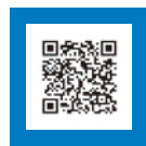
▲Eメールはコチラから!