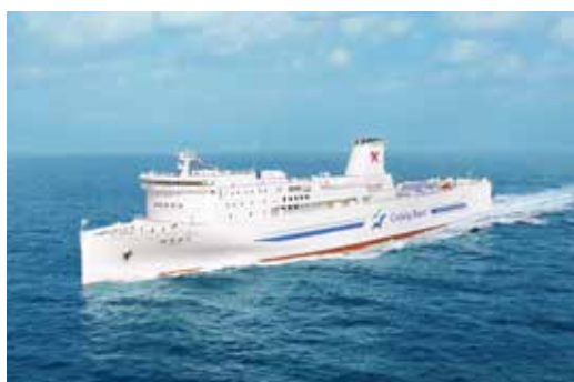
▲東京九州フェリー「はまゆう」

7月1日に就航した東京九州フェリー(横須賀⇄北九州)の船内見学会。9月20日(祝)A班(11～12時)とB班(12～13時)、東京九州フェリーフェリーターミナル(門司区新門司北三丁目)で。定各班150人。往復はがき(6人まで)に基本事項と参加希望班を書いて9月7日までに北九州港振興協会(〒801-1855 門司区西海岸二丁目2-7、☎321・5900)へ。