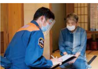
▲訪問の様子 (感染防止対策をしてお伺いしています)

北九州市では、高齢者の火災被害を防ぐため、市内全域で「住宅防火訪問」を行っています。80歳以上の方がお住まいのお宅を中心に、消防職員がお宅を訪問し、火災予防に向けた助言を行っています。また、健康状態などもお尋ねしています。これは、火災発生時に円滑な避難ができるかどうかを予め把握するためです。「火災ゼロ」、そして「火災による死者ゼロ」の実現を目標に、これからも取り組みを重ねていきます。