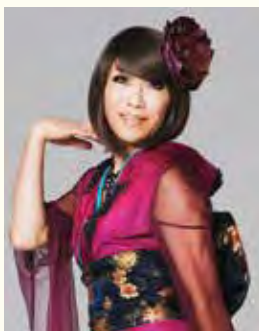
▲女装パフォーマーブルボンヌさん

女装パフォーマー・ブルボンヌさんによる講演「男らしさ・女らしさより『自分らしさ』で人は生きる！性と生を楽しく知ろう」。11月21日(日)14～15時40分、子どもの館(黒崎駅西側、コムシテイ7階)で。定125人。