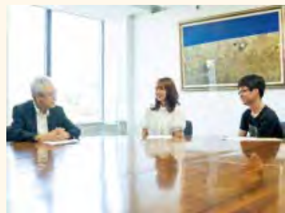
※撮影時だけマスクを外し、アクリル板を設置しています。

A3 確かに、注射した部位の痛み、発熱、頭痛、倦怠感など、若い世代ほど目立つ症状があるのは事実ですが、若い人に副反応が出やすいのは、生命活動が活発で免疫反応が顕著だからです。いわば「元気な証拠」であり、ほとんどは数日で回復します。ただし、ごくまれにアナフィラキシーショックと呼ばれる非常に強いアレルギー性の副反応が出る場合がありますが、治療法が