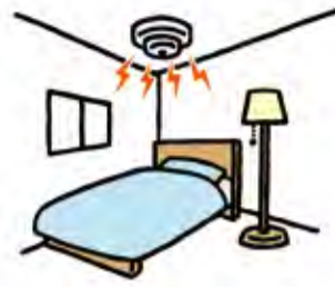
普段、寝室として使う部屋