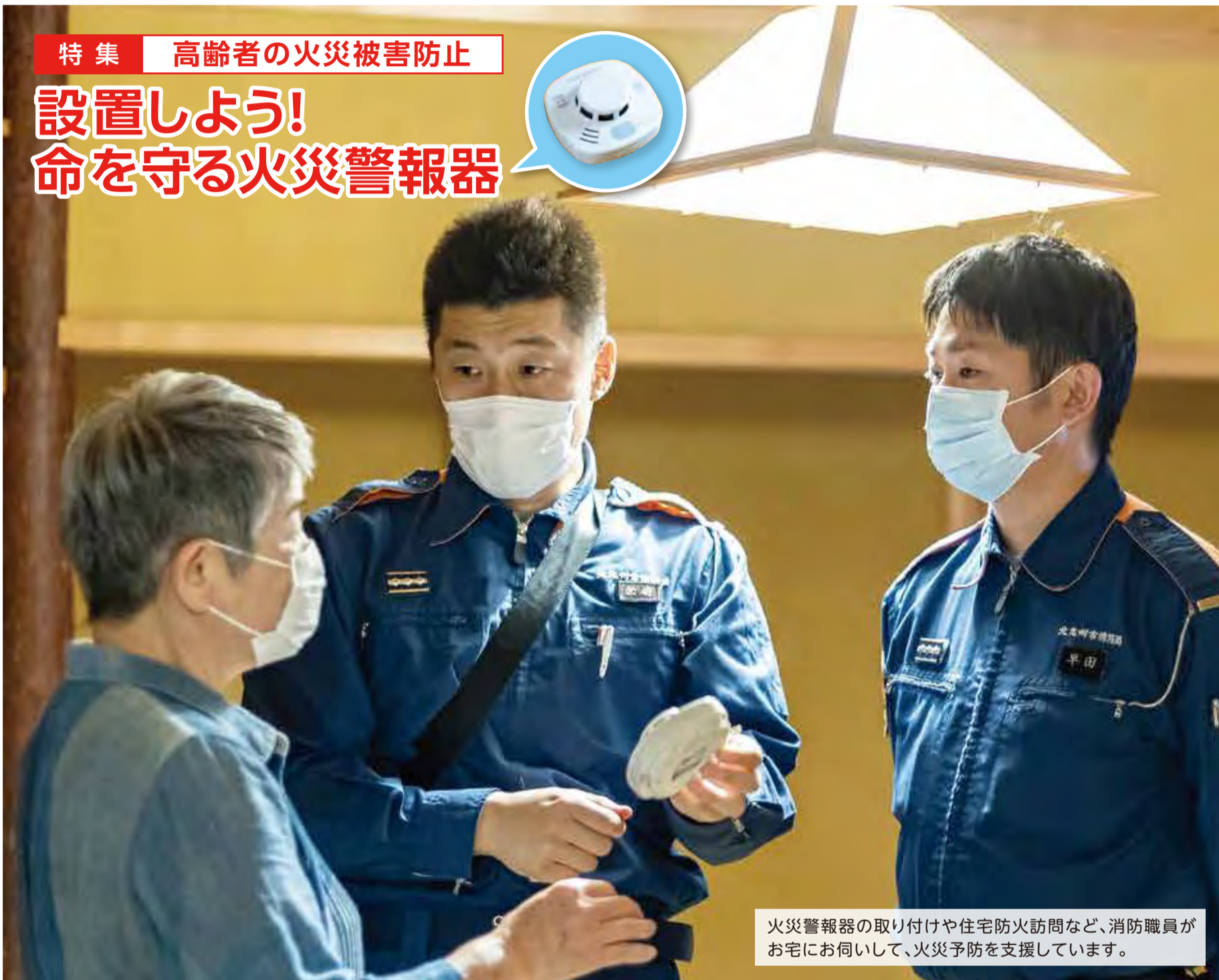
火災警報器の取り付けや住宅防火訪問など、消防職員がお宅にお伺いして、火災予防を支援しています。