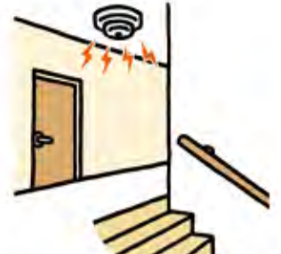
寝室がある階の階段上部