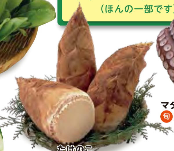
たけのこ 旬 1~4月 [小倉南区]