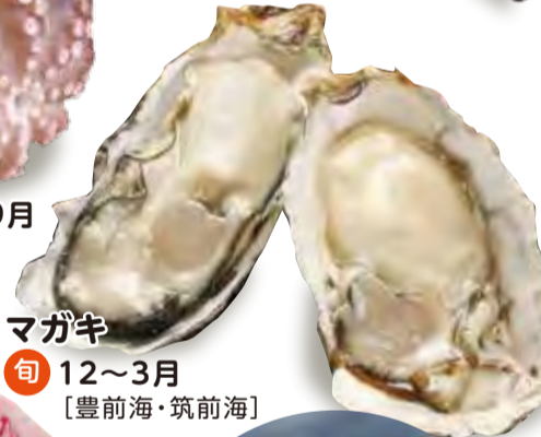
マガキ 旬 12~3月 [豊前海・筑前海]