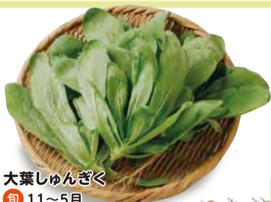
大葉しゅんぎく 旬 11~5月 [小倉南区]