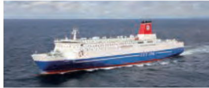
▲フェリーきょうと

名門大洋フェリーでの体験ツアー。1月14日(金)～16日(日)(2泊3日)。簡単な乗船レポートの提出あり。定20人。料中学生以上1万円、小学生5000円。☎往復はがき(4人まで)に基本事項を書いて12月21日までに北九州港振興協会(〒801-8555門司区西海岸一丁目2-7、☎321・5900)へ。☎港湾空港局クルーズ・交流課☎321・5939。