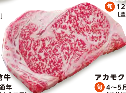
小倉牛 旬 通年 [小倉南区]