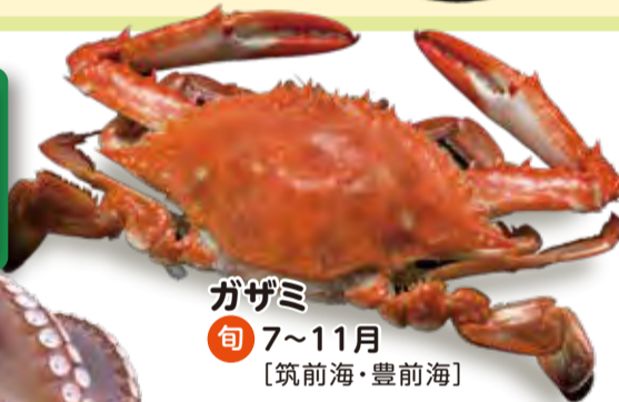
ガザミ 旬 7~11月 [筑前海・豊前海]