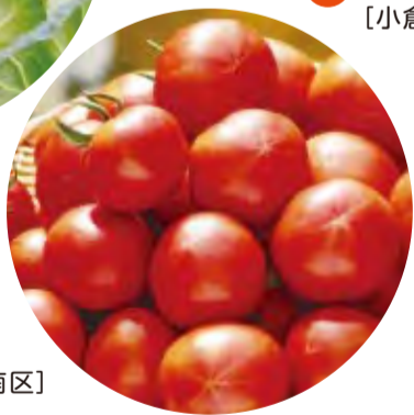
トマト 旬 2~8月 [若松区・小倉南区]