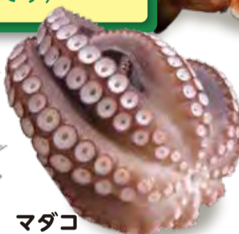
マダコ 旬 12~3月/6~9月 [筑前海・豊前海]