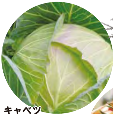
キャベツ 旬 11~4月 [若松区・小倉南区]