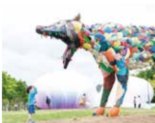
▲北九州未来創造芸術祭 ART for SDGs