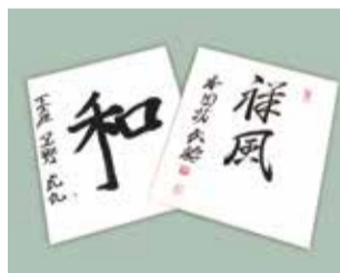
▲囲碁・第76期本因坊戦対局者サイン