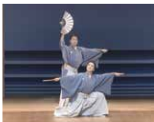
▲交流式典・新作日本舞踊「門司春秋」

昨年12月まで2年間にわたって開催した「東アジア文化都市北九州2020▶21」を振り返るパネル展です。イベントや文化交流の写真パネル、記念品などを展示します。*展示内容は会場によって異なります。