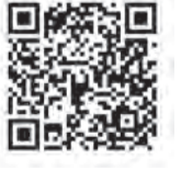
▲二次元コードを読み取り、デジタル版をご覧ください