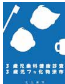
▲ステッカーが目印です