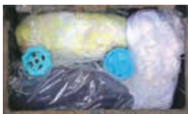
▲水道メーターの保温