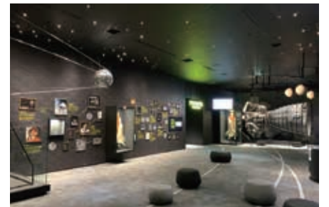
▲スペースラウンジ