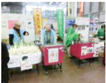
▲前回の開催の様子