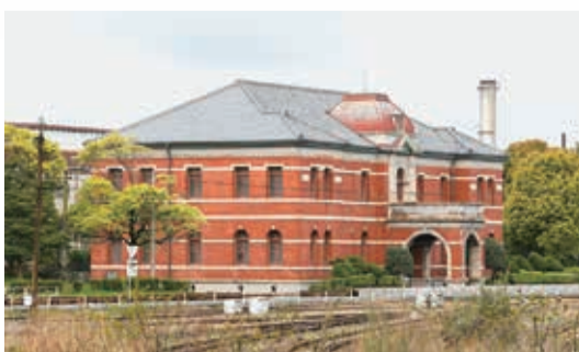
▲世界遺産「官営八幡製鐵所日本事務所」