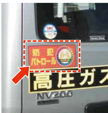
▲防犯パトロール実施中ステッカー

また、市では、「ながら見守り」を行っていただける企業や団体を募集しています。活動内容など詳しくは、お問い合わせください。