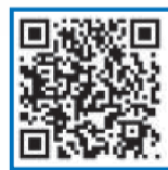
▲北九州国道事務所ホームページ

黒崎駅周辺の渋滞緩和などを目的に、国道3号黒崎バイパスの工事を進めてきました。このたび、春の町ランプと陣原ランプが3月18日(土)16時に開通します。なお、開通まで交通規制を伴う工事が続きますので、周辺を運転する際は、ご注意ください。詳細は北九州国道事務所に☎を。ホームページ(右記を読み取り)からも確認できます。