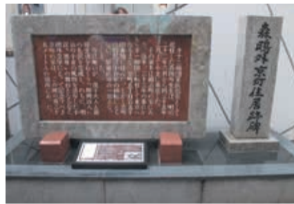
▲森鷗外京町住居跡碑

いずれも3月26日(日)。▶講演会「森鷗外を顕彰する北九州の人々～『或る小倉日記』伝』から今日まで」=14～15時30分、北九州文学サロン(小倉北区京町一丁目)で ▶碑前の会=作品の朗読など。16～16時20分、森鷗外京町住居跡碑前(小倉駅南側)で。共通☎定先着各15人。☎3月17日から森鷗外旧居☎531・1604へ。担市民文化スポーツ局文化企画課☎582・2391。