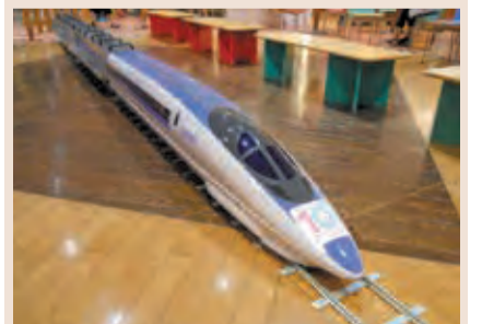
共通申①②は必要。電話で①は4月3日、②は5日から同施設へ。

③ミニ新幹線に乗ろう! 4月22日(土)、23日(日)の13～15時30分。料1回100円(おもちゃ付き)。