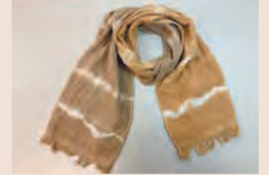
共通申電話で4月4日から同施設へ。

玉ねぎの皮染め体験 ストールを染めます。4月22日(土)10時30分～12時30分。対18歳以上。定先着10人。料3200円。