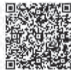
▲動画はコチラから

介護予防に役立つ、本市オリジナルの「ひまわり太極拳」の動画をリニューアルしました。画像が鮮明になり、12の型について、体を動かす方向を一つずつ矢印などで分かりやすく表示しています。動画は認知症支援・介護予防センターのホームページ(下記を読み込み)でもご覧になれます。☎同センター ☎522・8765へ。