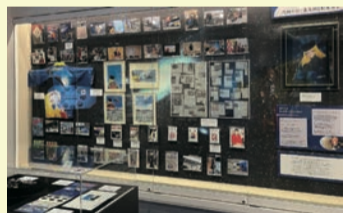
▲追悼展 漫画の街・北九州と松本零士

また、小倉駅周辺などには松本零士作品のキャラクター像やデザインマンホールがあります。漫画ミュージアムのホームページで関連スポットの「まち歩きMAP」も公開中です。松本零士さんに思いをはせつつ、小倉の街を歩いてみませんか。