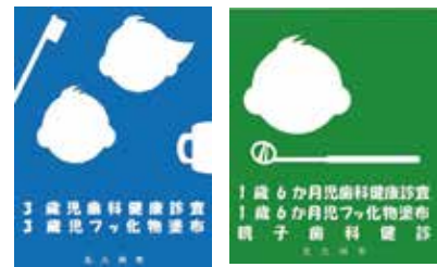
▲ステッカーが目印です

口腔がん検診や人形劇など。6月4日（日）11～14時、子育てふれあい交流プラザ（小倉駅北側、AIMビル3階）で。詳しくは、北九州市歯科医師会 ☎513・3650へ問を。