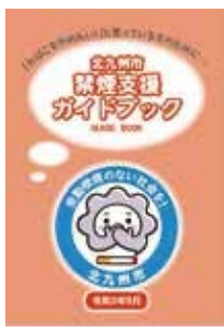
▲禁煙支援ガイドブックはコチラから