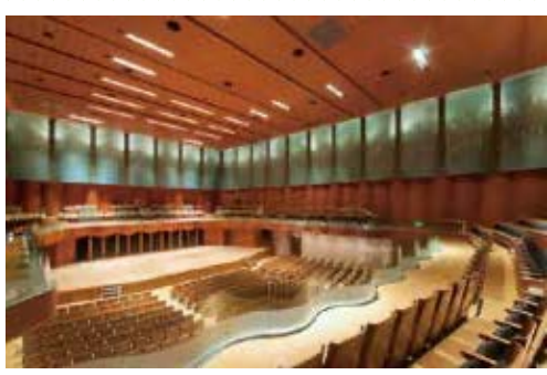
▲優れた音響を誇る音楽ホール