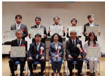
▲よい歯の学校及び口腔衛生功労者表彰式