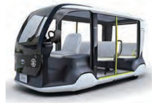
▲EVモビリティ(電気自動車)