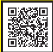
▲大会公式 ホームページ