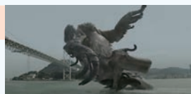
▲カニ・フグ・タコが合体した怪獣が登場

北九州市と下関市が共同で制作した関門海峡PRムービー「COME ON!関門」は、自治体が制作したPR動画としては異例の再生回数(6言語計で4億回以上)を誇ります。