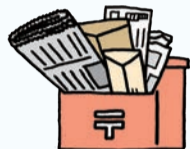
郵便物・新聞が たまっている