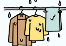
洗濯物が 干しっぱなし