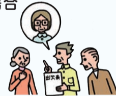
いつものサークルに しばらく来ない