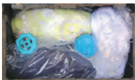
▲水道メーターの保温