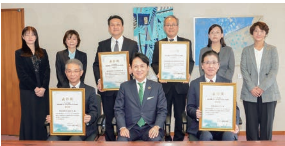
▲女性活躍・ワークライフバランス表彰式

障害者差別解消法の改正により、令和6年4月1日から、事業者による障害のある人への合理的配慮の提供が「努力義務」から「義務」化されます。