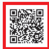
▲詳しくは こちらから