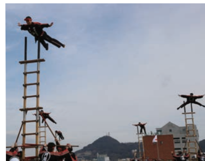
▲消防団員のはしご乗り

市制60周年記念 消防出初式を開催 消防団員のはしご乗り、まとい振りなどの演技や、レスキュー隊員による救助救出演技、音楽隊の演奏など。 1月7日(日)9時30分~11時45分、関門海峡ミュージアム横芝生広場(門司港レトロ地区)で、荒天中止。