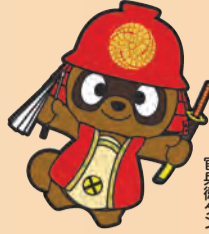
八幡西区マスコット キャラクタ 官兵衛タン