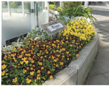
▲小倉駅のスポンサー花壇