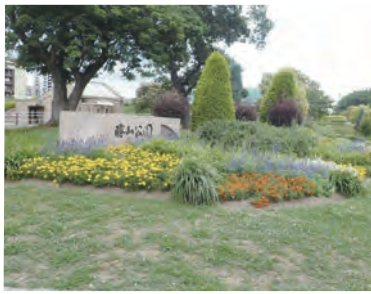
▲勝山公園のスポンサー花壇