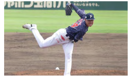
北九州下関フェニックス

「北九州下関フェニックス 対 大分B-リングス」の野球観戦に親子を招待します。3月16日(土)14時から、北九州市民球場(小倉北区三萩野二丁目)で。対小・中学生と保護者(1組5人まで)。定300人。申往復はがき(1組だけ)に基本事項を書いて1月24日までに〒803-8501市民文化スポーツ局スポーツ振興課(☎582・2395)へ。ネットも可。