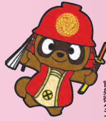
八幡西区マスコット キャラクタ 官長衛タン