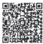
▲申し込みほか 詳細はコチラから

対平成6年4月2日～平成15年4月1日生まれの人、または平成15年4月2日以降に生まれ、大学を卒業したか、来年3月までに卒業見込みの人。共通第1次試験は5月26日(日)。申3月25日までに国税庁ホームページ(下記を読み取り)から。申方法については人事院人材局試験課 ☎(03)3581・5311へ、そのほか詳細は福岡国税局人事第二課 ☎(092)411・0031へ問を。