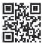
▲ヘルスケアラボはコチラから

女性は「思春期」「成熟期」「更年期」「老年期」それぞれのホルモン状態により、男性とは違った心身の変化があります。こうした変化が引き起こす心身のトラブルには個人差があり、悩みを相談できず我慢している人も多くいます。厚生労働省が監修するホームページ「ヘルスケアラボ」では、このようなトラブルへの対処法や相談できる医療機関などを紹介しています。ぜひご利用ください。