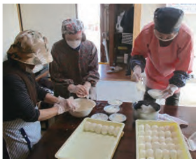
▲高齢者に提供するお弁当を作っている様子(友愛訪問活動)