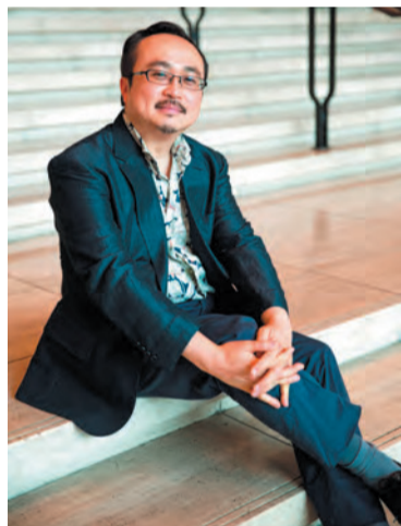
▲ダン・タイ・ソン

6月22日(土)15~17時、響ホール(八幡東区平野一丁目、☎663・6567)で。対小学生以上。料前売り(全席指定)S席5000円、A席3500円、25歳以下(A席)2000円(身分証の提示が必要)。当日は500円増し。前売り券は3月22日から主要プレイガイドなどで発売。託児(有料)は同施設☎663・6661へ問を。