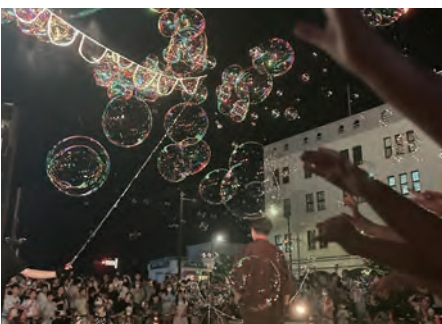
▲前回開催の様子(門司港駅前)