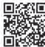
▲各種手続きの詳細はコチラから

北九州市では、「書かない」「待たない」「行かなくていい」区役所の実現に向けて、オンライン化などの取り組みを進めています。