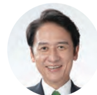
北九州市長 武内 和久

新たな季節を、晴れやかな気持ちでスタートできるよう、お祈りします! 私も市長就任から1年が経過し、さらにギアを上げて頑張ります!