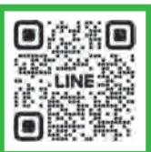
▲友だち追加はコチラから

LINEで「北九州市」を友だち追加すれば、防災や子育てなどの暮らしに役立つ情報を受け取ることができます。