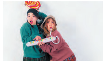
▲ふるまちなシスターズ

共通 申 ②は必要。電話で3月17日から門司麦酒煉瓦館(門司駅北側、☎382・1717)へ。