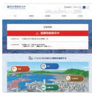
▲「防災情報北九州」画面イメージ