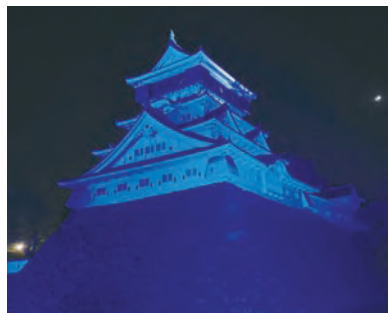
▲小倉城のブルーライトアップ

市立図書館内に関連図書を集めたコーナーを設置します。期間は各図書館により異なります。詳細は 図 を。