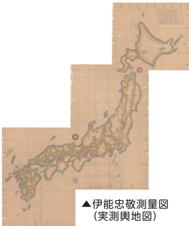
▲伊能忠敬測量図(実測輿地図)

ゼンリンミュージアム(リバーウォーク北九州14階(受け付けは4階)に保管されている「伊能忠敬測量図(実測輿地図)」が国の重要文化財(歴史資料)に指定される見通しとなりました。