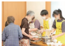
▲はなのじカフェ(子ども食堂)の様子

若松区西部の花野路地区にある当自治会では、現在、集会所を活用した集いの場づくりに力を入れています。民間団体(こども食堂まあ〜る)から子ども食堂の相談があった際は、多世代が交流できるカフェ形式にしてほしいとリクエストして、自治会は広報を手伝うという形で開催しています。未就学児から高齢者まで集まって食事などを共にすることで新たなコミュニティの形成にもつながっています。今後も例えば居酒屋形式など、いろいろな交流の場を作っていきたいです。