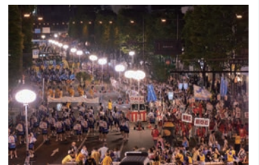
▲平家踊総踊り大会

下関駅前や唐戸地区周辺で、平家一門の供養の踊りに源を発した平家踊総踊りなど、下関の魅力が詰まったさまざまな催しを行います。▶関門よさこい大会=8月23日(土) ▶平家踊総踊り大会=8月24日(日)。共通時間など詳細は下関まつり合同会議事務局☎(083)227・3305へ問を。イベント特設サイトからでもご覧になれます。