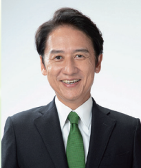
北九州市長 武内 和久