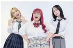
▲かわいいまぐねっと