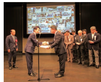
▲昨年の事業者表彰の様子