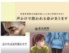
▲小倉駅の大型ビジョンなどで啓発動画を放映