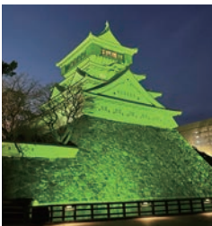
▲小倉城ライトアップ